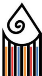
Liceo Artistico Artemisia Gentileschi Carrara