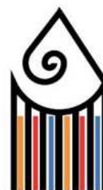
IPIAM P. Tacca Carrara