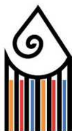
Liceo Artistico A. Gentileschi Carrara